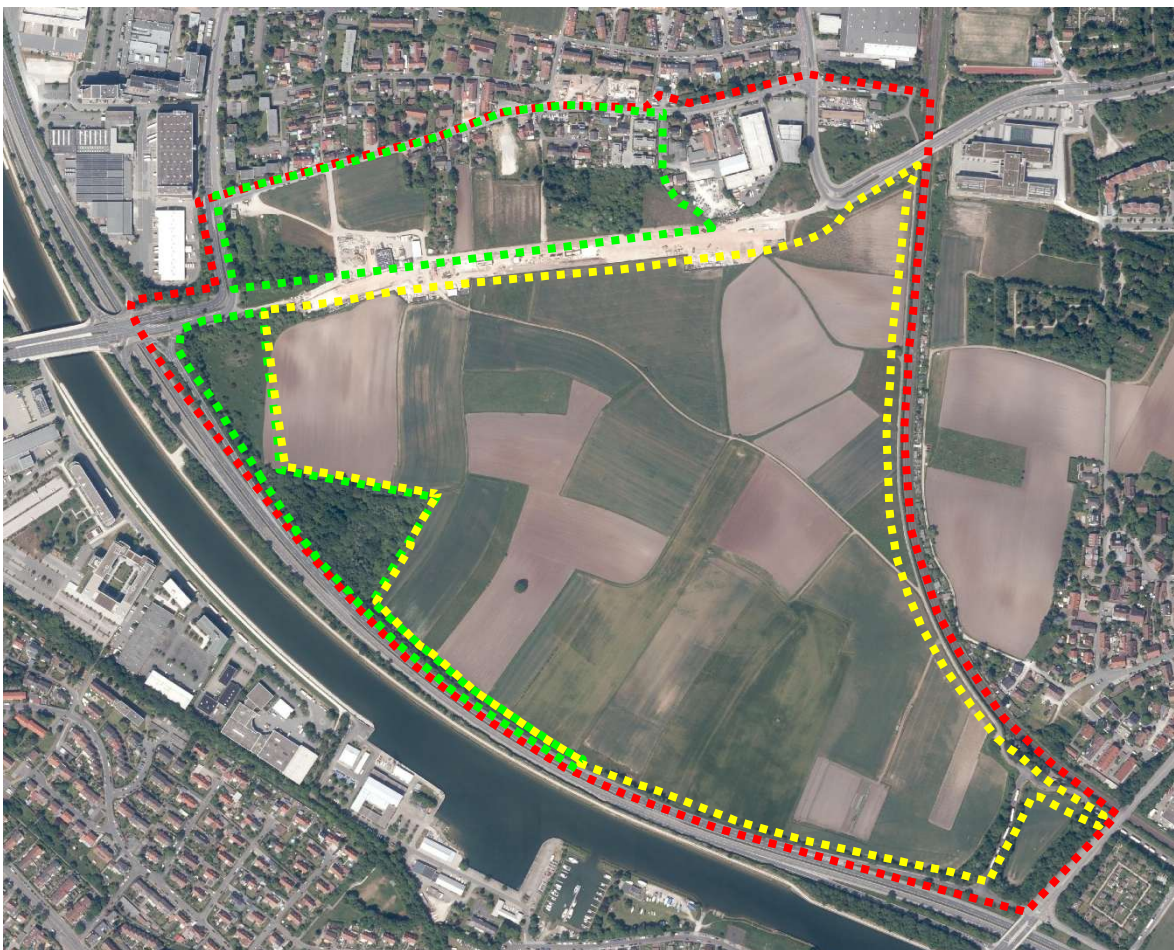
Abbildung 1: Untersuchungsbereich für Gesamt-saP zum Rahmenplan (rot gestrichelt), sowie Geltungsbereich des schon rechtskräftigen BP Nr. 4445a (grün gestrichelt) und des in Aufstellung befindlichen BP Nr. 4445b „Tiefes Feld Süd“ (gelb gestrichelt umrandet)

Die faunistischen Erfassungen im Untersuchungsbereich erfolgten in Abstimmung mit dem Umweltamt der Stadt Nürnberg für die Artengruppen, für die eine artenschutzrechtliche Relevanz erkennbar war. Es handelt sich um Vögel, Fledermäuse, Reptilien (insbesondere Zauneidechse), Amphibien und den Nachkerzenschwärmer (einer Nachfalterart). Ferner wurden in den vorhandenen Baum- und Gehölzbeständen innerhalb des Untersuchungsbereichs Baumhöhlen bzw. Biotopbäume erfasst.