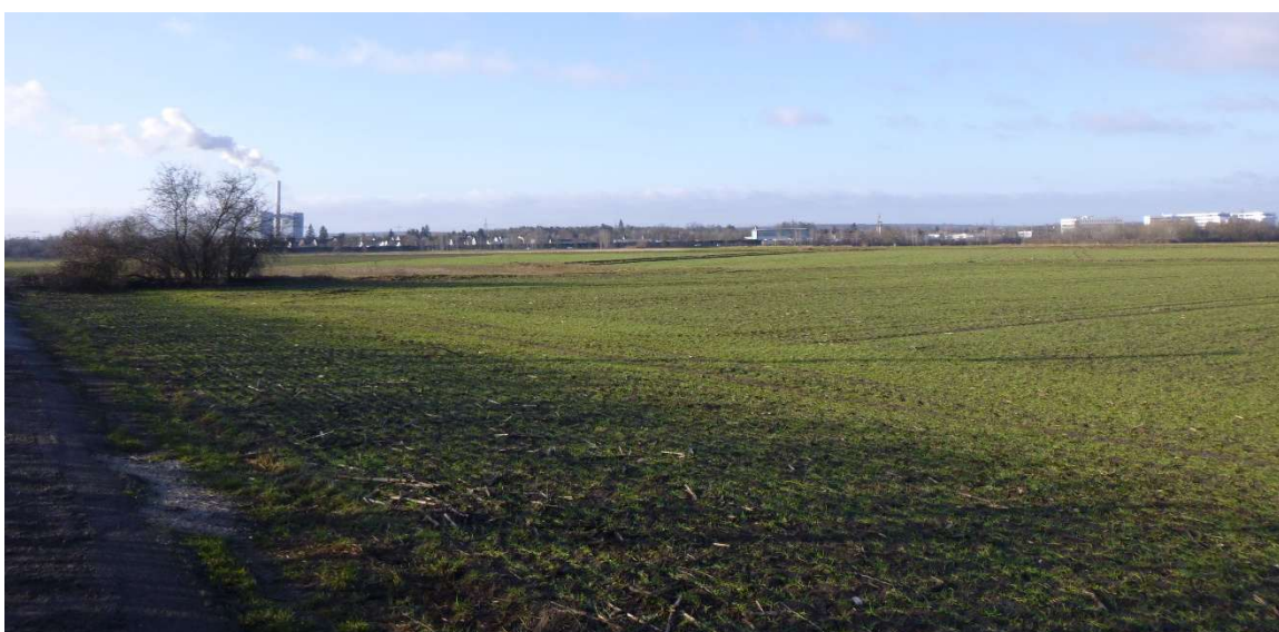
Abbildung 2: Blick über die offenen Ackerflächen im Untersuchungsbereich von Norden entlang der Uffenheimer Straße in Richtung Süden (eigene Aufnahme am 23.02.2022).

Die Böschungen an der Uffenheimer Straße im Südosten werden durch einen jungen Bestand von Feld-Ahorn ( Acer campestre ), Spitz-Ahorn ( Acer platanoides ) und Stiel-Eiche ( Quercus robur ) sowie Sträuchern wie Schwarzer Holunder ( Sambucus nigra ), Hasel ( Corylus avellana ) und Liguster ( Ligustrum vulgare ) geprägt. Diese gehen in eine Baumhecke über, die entlang der alten Wallensteinstraße in Richtung Südwesttangente verläuft. Hier stehen Hainbuchen ( Carpinus betulus ), Sand-Birken ( Betula pendula ), Feld-Ahorn ( Acer campestre ) und Stiel-Eichen ( Quercus robur ) in junger bis alter Ausprägung. Davon weisen einzelne Bäume eine artenschutzrechtliche Relevanz (Höhlen, abstehende Borke, stehendes Totholz) auf.