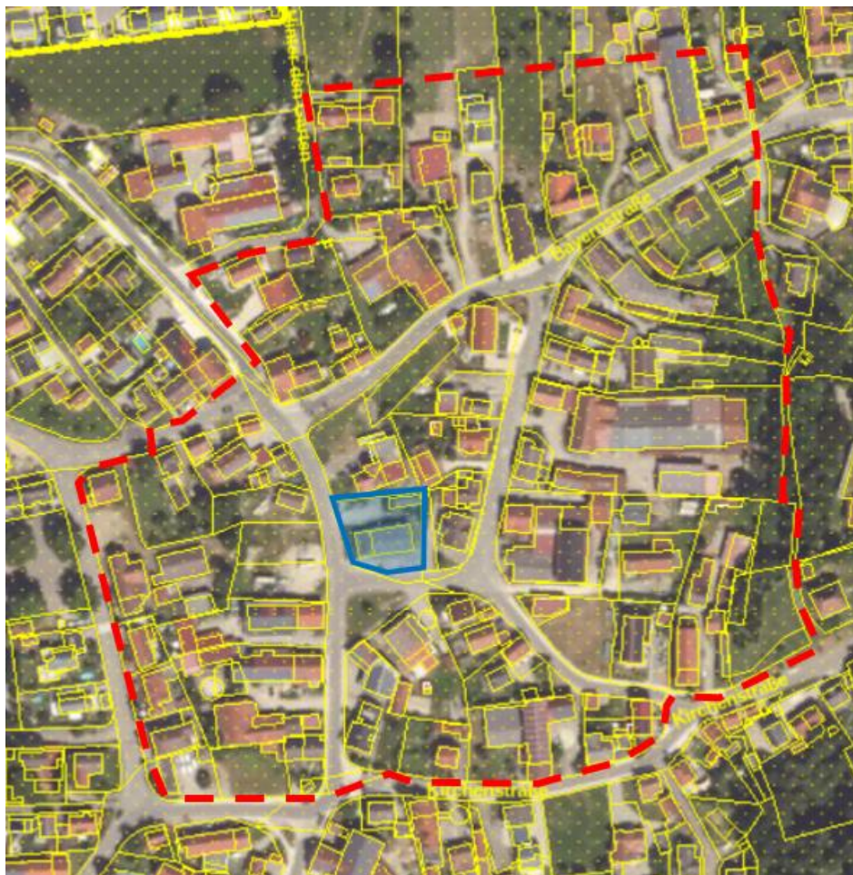
Abb. 1: Lage der Untersuchungsfläche (Rot=Untersuchungsfläche, Blau=Lage aktuelles Bauvorhaben (Luftbild aus https://geoportal.bayern.de/bayernatlas )

Der Betrachtungsraum der artenschutzrechtlichen Prüfung umfasst den unten dargestellten Geltungsbereich.