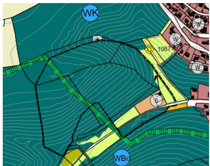
Ausschnitt rechtskräftiger Flächennutzungsplan Stadt Treuchtlingen mit Geltungsbereich der Änderung

Der Stadtrat hat in seiner Sitzung am 23.04.2026 außerdem den Vorentwurf zur 8. Flächennutzungsplanänderung gebilligt und beschlossen, die öffentliche Auslegung gemäß § 3 Abs. 1 BauGB sowie die Beteiligung der Nachbargemeinden, Behörden und sonstiger