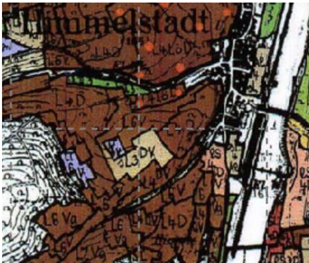
Böden im Plangebiet Darstellung ohne Maßstab

Im Plangebiet bestehen durch bestehende Verkehrsflächen und die bisherige intensive landwirtschaftliche Nutzung (Ackerflächen) entsprechende Vorbelastungen der natürlichen Bodenpotentiale durch Versiegelung, Verdichtungen und Umlagerungen.