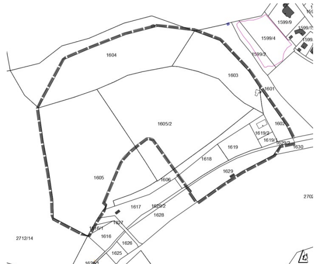
Geltungsbereich des Bebauungsplans TR Nr. 52 "Sondergebiet Freizeit im Heumöderntal"

Der Stadtrat hat in seiner Sitzung am 23.04.2026 den Vorentwurf zum Bebauungsplan TR Nr. 52 "Sondergebiet Freizeit im Heumöderntal" gebilligt und beschlossen, die öffentliche Auslegung gemäß § 3 Abs. 1 BauGB sowie die Beteiligung der Nachbargemeinden, Behörden und sonstiger Träger öffentlicher Belange gemäß § 4 Abs. 1 BauGB zum Vorentwurf des o.g. Bebauungsplans in der Fassung vom 09.04.2026 durchzuführen.