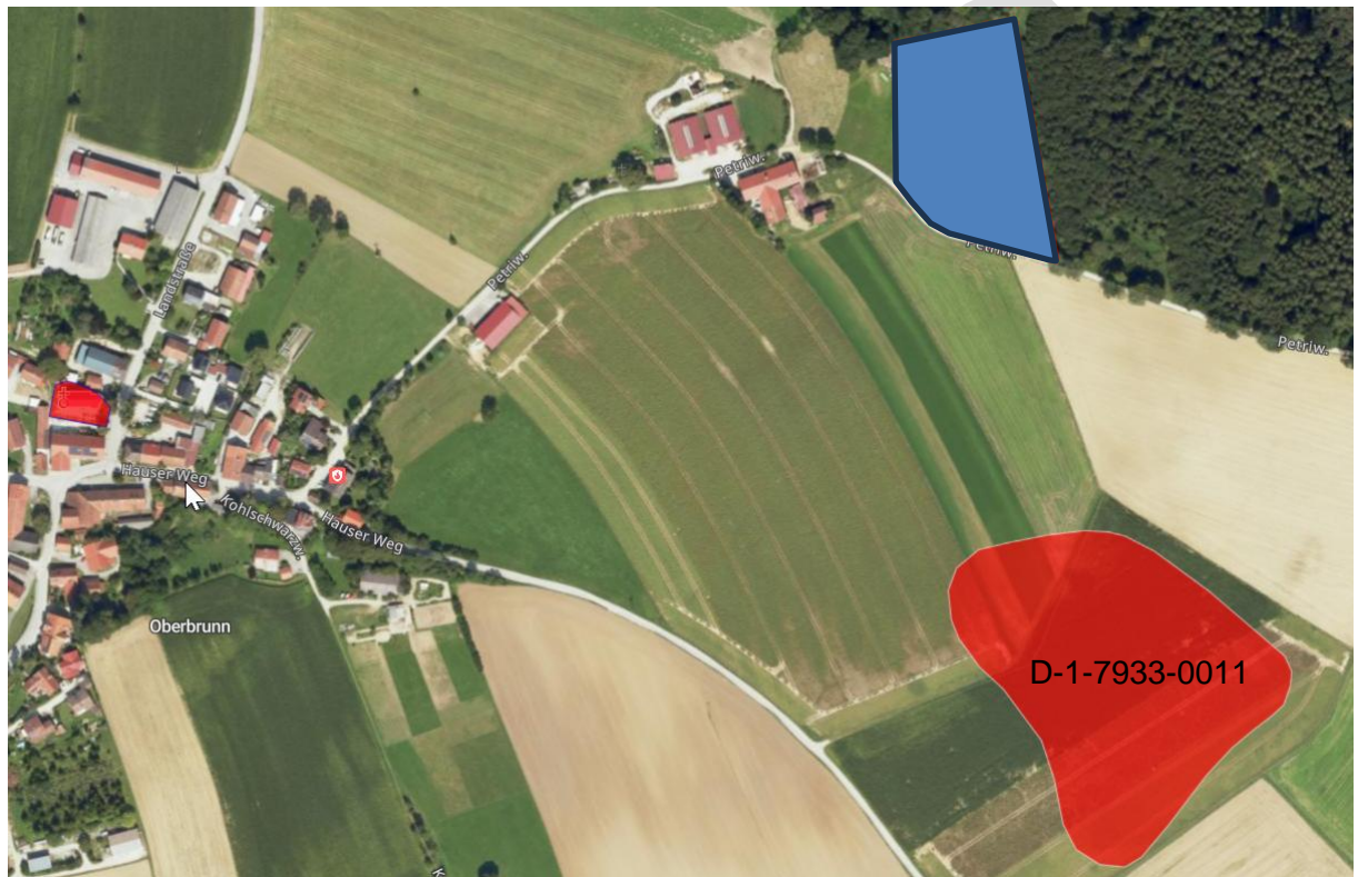
Abb. 3 Bau- und Bodendenkmäler, ohne Maßstab

In der näheren Umgebung, insbesondere im Bereich der Ortsmitte ist das Baudenkmal Dorfkirche „St. Peter und Paul“ (D-1-88-120-46) vorhanden, für die jedoch von der beabsichtigten Änderung keine Beeinträchtigung zu befürchten ist.