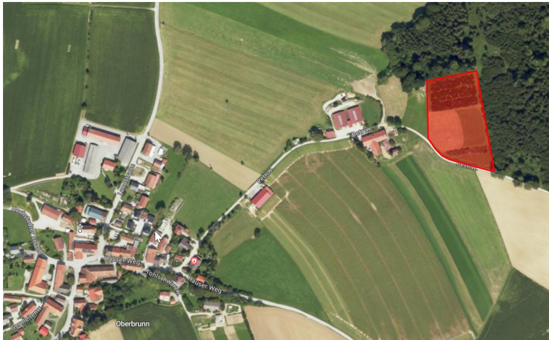
Abb. 1 Plangebiet, ohne Maßstab

Der Bebauungsplan trifft Festsetzungen zu Art und Maß der baulichen Nutzung, zu den überbaubaren Flächen, sowie den naturschutzfachlichen Ausgleichsmaßnahmen.