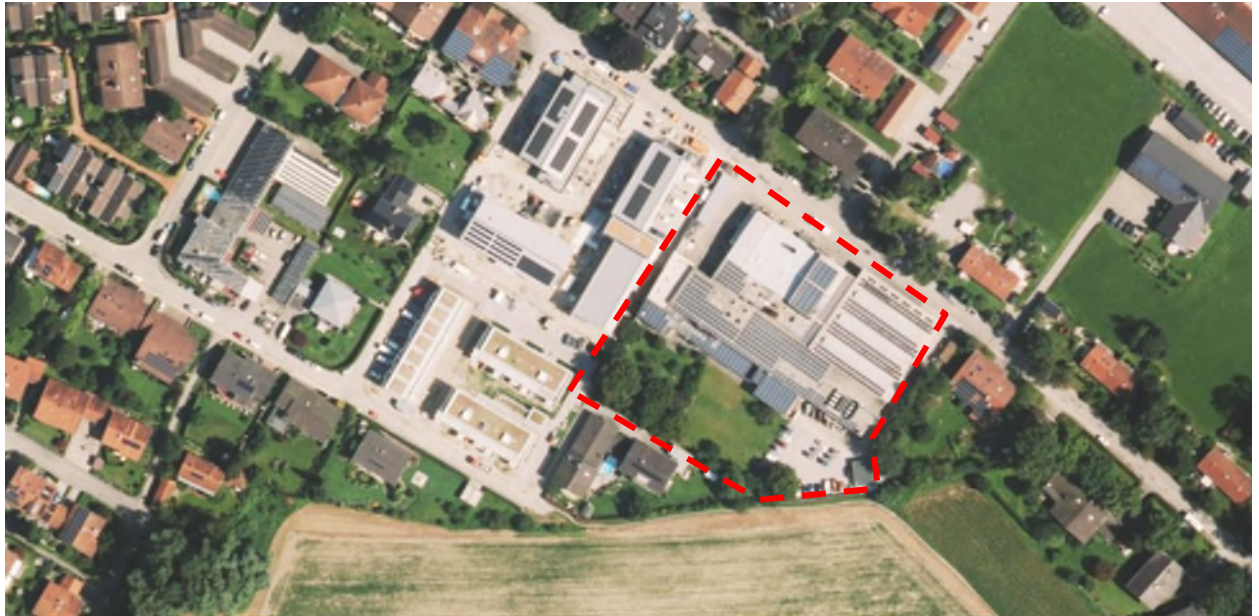
Abbildung 2: Änderungsbereich der hier gegenständlichen Änderung rot – ohne Maßstab!

Das Planungsgebiet liegt etwa 2,0 km östlich des Ortszentrums von Stephanskirchen Schloßberg. Es befindet sich am östlichen Rand der Siedlungsfläche von Haidholzen.