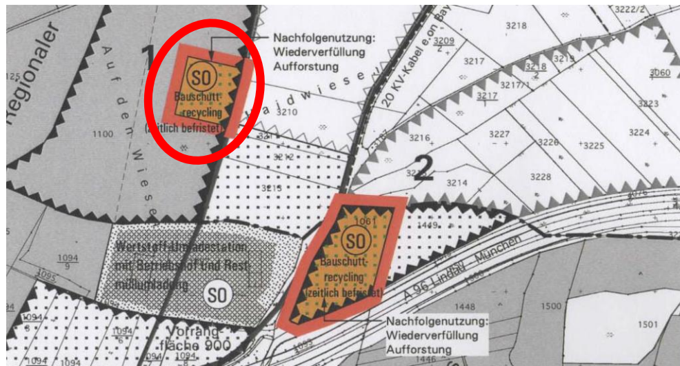
Abb. 3 Ausschnitt aus dem wirksamen FNP mit Lage der 3.Änderung, ohne Maßstab

Im Rahmen der 1. Änderung des Flächennutzungsplans wurde der Geltungsbereich der 2. Bebauungsplanänderung als Sondergebiet „Bauschuttrecycling“ zeitlich befristet dargestellt. Für die ehemalige Kiesabbaufläche ist als Nachfolgenutzung eine Waldnutzung als Rekultivierungsziel dargestellt. Die 1. Änderung des Flächennutzungsplans der Gemeinde Weßling in der Fassung vom 27.07.2006 wurde vom Gemeinderat am 26.09.2006 durch Beschluss verbindlich festgestellt und vom Landratsamt Starnberg am 01.02.2007 genehmigt.