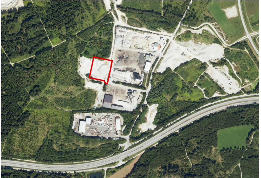
Abb. 1 Plangebiet, ohne Maßstab, Stand 01.04.2026