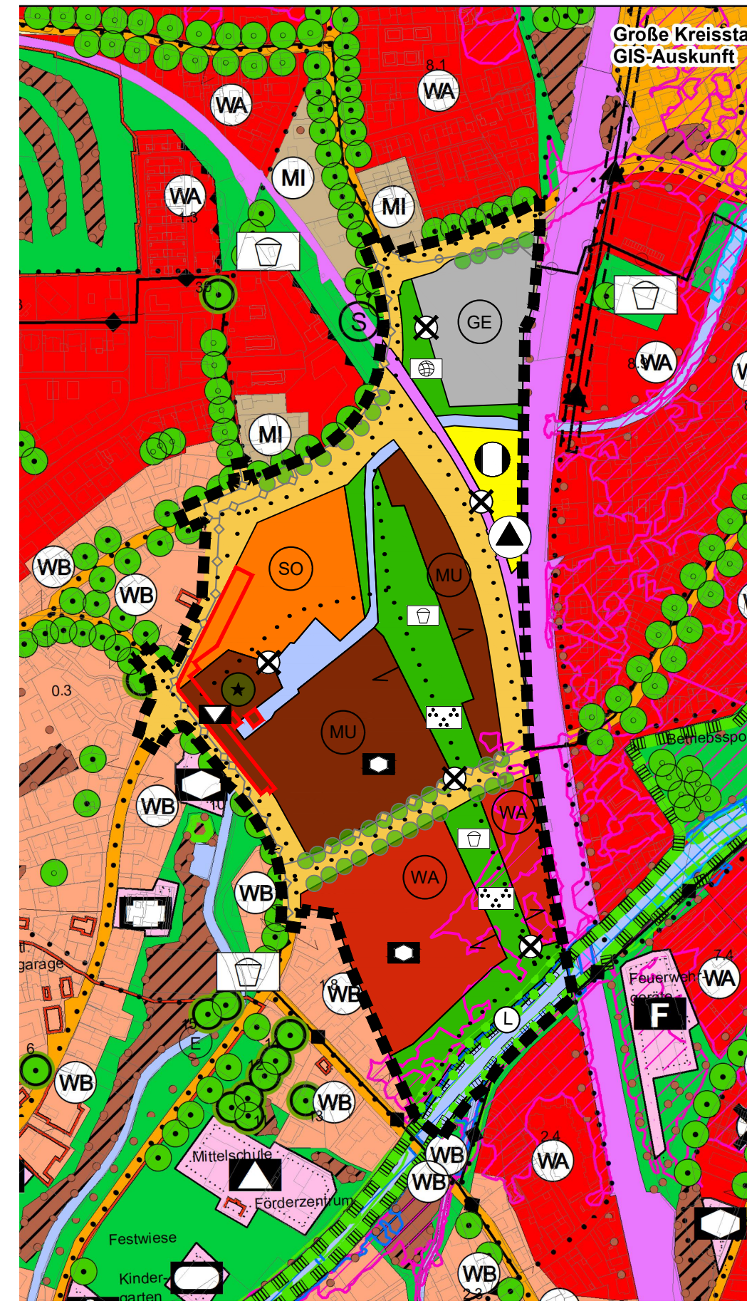
Flächennutzungsplan Änderung, M 1:5.000