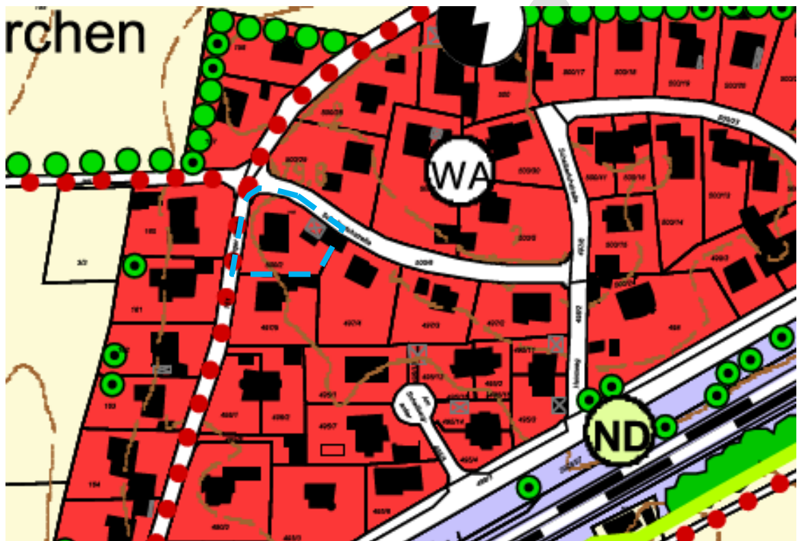
Abbildung 2: Darstellung des Änderungsbereiches im gültigen Flächennutzungsplan - blau - ohne Maßstab

Im Rahmen der hier gegenständlichen 13. Änderung wird die Art der Nutzung nicht geändert. Somit kann die 13. Änderung des Bebauungsplans Nr. 39 „Scheiberloh“ gemäß § 8 Abs. 2 BauGB aus dem Flächennutzungsplan entwickelt werden. Dem Entwicklungsgebot ist somit Genüge getan.