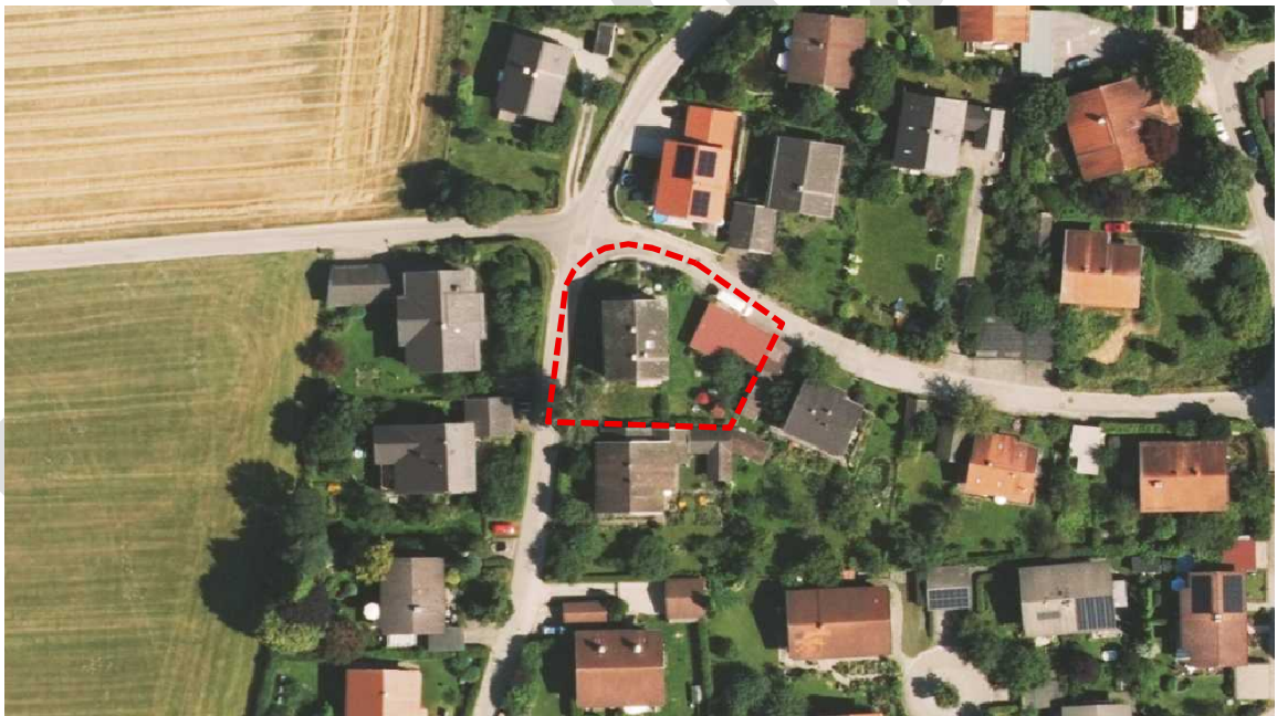
Abb. 1: Lage des Änderungsbereiches – rot - ohne Maßstab

Der Änderungsumgriff befindet sich im Ortsteil Scheiberloh etwa 3 km östlich des Ortszentrums von Stephanskirchen (Schloßberg). Der Geltungsbereich umfasst das Flurstück Nr. 500/2 sowie Teilflächen der Flurstücke mit den Nrn. 497/6 (Scheiberlohstraße) und 151 (Kielinger Straße). Die Fläche befindet sich in der Gemarkung Stephanskirchen. Der Änderungsumgriff hat eine Größe von ca. 1.070 m 2 .